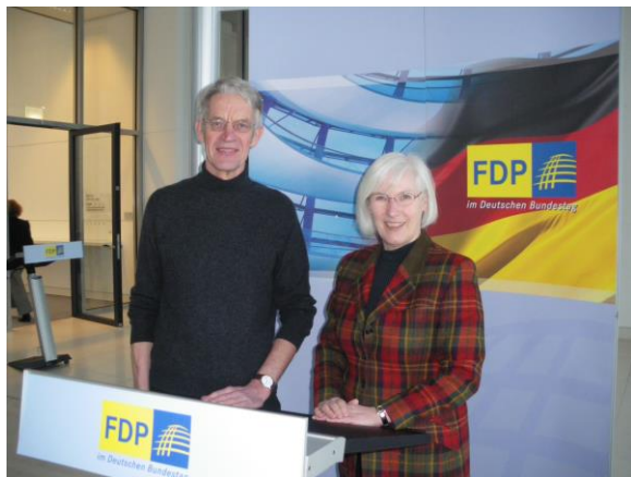
Kirchenkommission tagt im Bundestag (Jan. 2009)