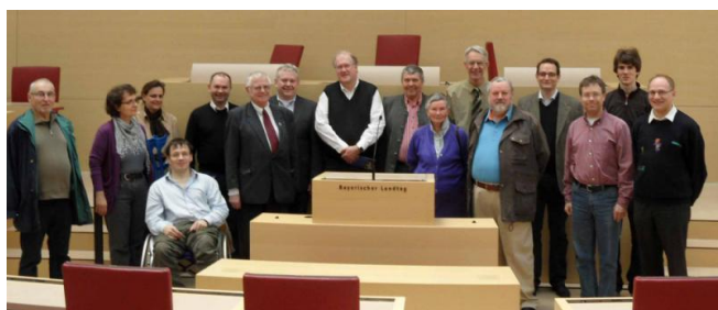
Expertenanhörung: Liberale Christen im Maximilianeum